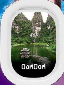
นิงห์บิ่งห์