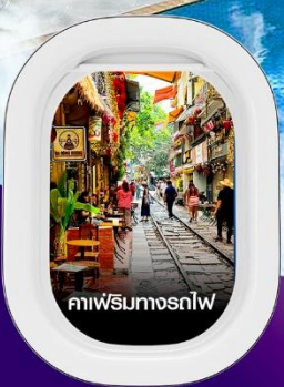
คาเฟ่ริมถนน