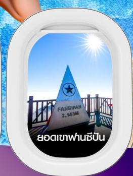
ยอดเขาฟานซิปิน

คอนเฟิร์มออกเดินทาง ทุกปีเร็ว 2 ท่านขึ้นไป