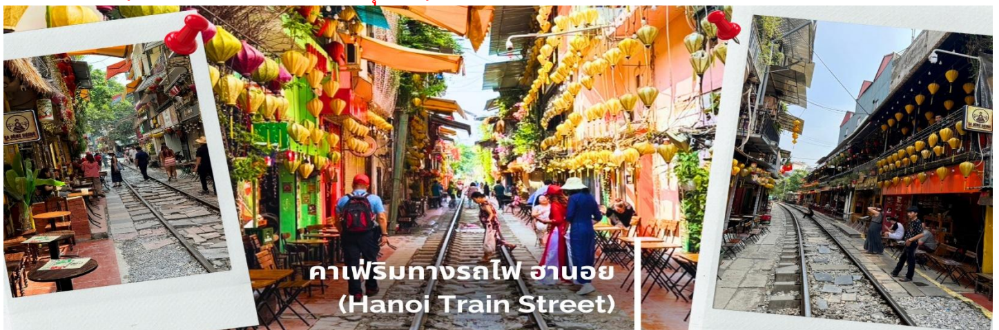
คาเฟ่ริมทางรถไฟ ฮานอย (Hanoi Train Street)

เที่ยง รับประทานอาหารกลางวัน ณ ภัตตาคาร (8) จากนั้นนำท่านเข้าสู่ คาเฟ่ริมทางรถไฟ (HANOI TRAIN STREET) เป็นหนึ่งในสถานที่ท่องเที่ยว ที่มีชื่อเสียงและน่าผจญภัยในฮานอย ตั้งอยู่ในตรอกแคบๆ ย่าน Old Quarter ของฮานอย ซึ่งล้อมรอบด้วยบ้านทรงสูงแคบที่อยู่ติดกันแน่นๆ จุดเด่น คือ สามารถนั่งมองรถไฟวิ่งผ่านอย่างใกล้ชิด ได้วันละหลายรอบ ที่ถ่ายรูปออกมาสวย ถนนสายเล็กๆ สองข้างทางจะเป็นบ้านผู้คน ที่อาศัยอยู่จริง และมีคาเฟ่น่ารักเยอะมาก (ไม่รวมค่าอาหารและเครื่องดื่มทุกชนิด)